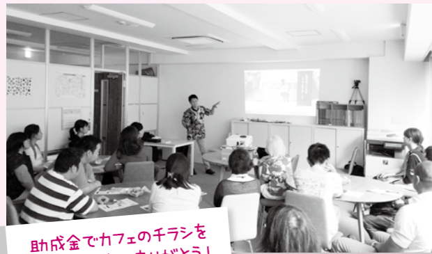
助成金でカフェのチラシをつくっています。ありがとうございます！

開催日●毎月第4金曜日 14:00～16:00 利用料●100円(1ドリンク・お菓子付) 実施団体●スマイルプラス烏丸御池センター (障害者就労移行施設)