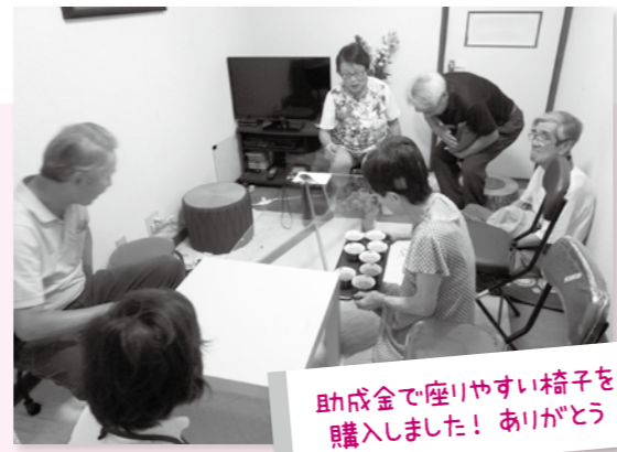
助成金で座りやすい椅子を購入しました！ありがとうございます

私たちは京都市中部エリア(中京区・下京区・南区)で主な活動を行っています。中京ふれあいまつりへの出店や、身近な場所でのサロンを開催しています。平成24年10月からサロンを開始し、参加者の身体的変化により、身近にある小さなハンディが参加の妨げにならないようにと考えて助成金を活用しました。お互いが自然と参加したくなるような、そんなサロンを目指しています！