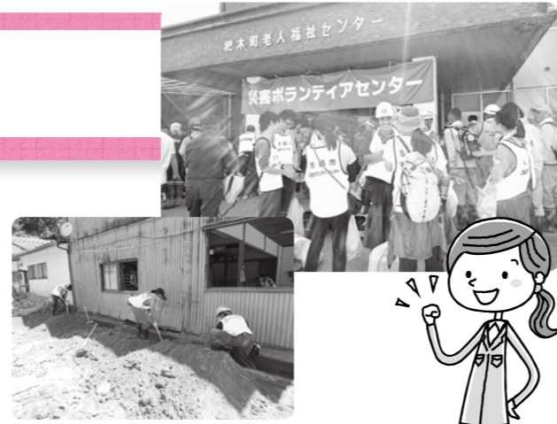
●写真は、京都市災害ボランティアセンター（運営：京都市社協等）が派遣したボランティアが、被災地で活動する様子

中京区社会福祉協議会では、いつ起こるかわからない災害に備え、日ごろから地域のつながりを深める活動や、災害ボランティアセンターに関する啓発、ボランティアに関する講座などを行っています。