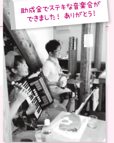
助成金でステキな音楽会ができました！ありがとうございます！

ももとは、障害のある子の将来的自立を目指したランチ販売から始まり、地域に定着しています。障害のあるなしにかかわらず、子どもたちが自分らしく生きられることを考えたいとの願いをこめて、公募助成を利用して、多世代交流へ取り組みました。