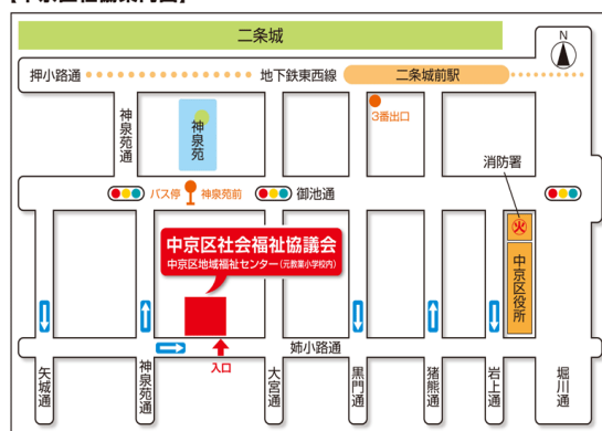
【中京区社協案内図】

※京都市が、地域で高齢者を支えていくために必要な生活支援サービスの創出や担い手の養成、ネットワークの構築を目的として各区社会福祉協議会に配置しているコーディネーターです。